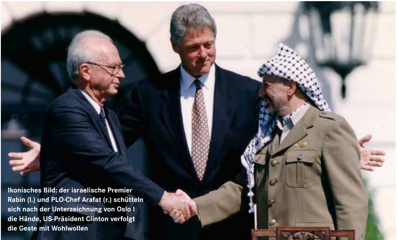
Ikones Bild: der israelische Premier Rabin (l.) und PLO-Chef Arafat (r.) schütteln sich nach der Unterzeichnung von Oslo I die Hände, US-Präsident Clinton verfolgt die Geste mit Wohlwollen

Vor 30 Jahren verständigten sich Israel und die PLO auf erste Schritte zur palästinensischen Autonomie. Der Prozess war von Anfang an mit Illusionen verbunden.