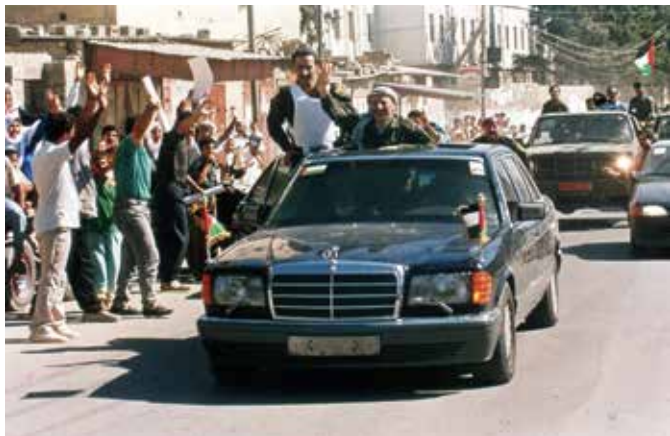
Im Juli 1994 fährt Arafat triumphal in den Gazastreifen ein. In seinem Konvoi schleppt er vier Terroristen ein.

Gazastreifens und aus Jericho vor sowie die Einrichtung einer „nationalen Behörde“. Damit soll dann eine fünfjährige Übergangszeit mit weiteren Abzügen beginnen. Spätestens ab dem dritten Jahr sollen Verhandlungen für eine dauerhafte Regelung stattfinden.