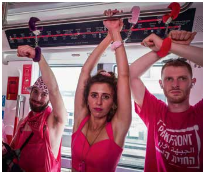
Einige Demonstranten ketteten sich mit Handschellen in einer Bahn an

Besonders frustrierend: Merav Michaeli (Arbeitspartei), die vorige Verkehrsministerin Israels, hatte noch zugesagt, dass die Bahn den ganzen Freitag und Samstag fahren werde. Doch das löste Widerstand in Bnei Brak aus. Denn dass ausgerechnet in ihrer Stadt eine Tram die Schabbatruhe stört, kam für die ultra-