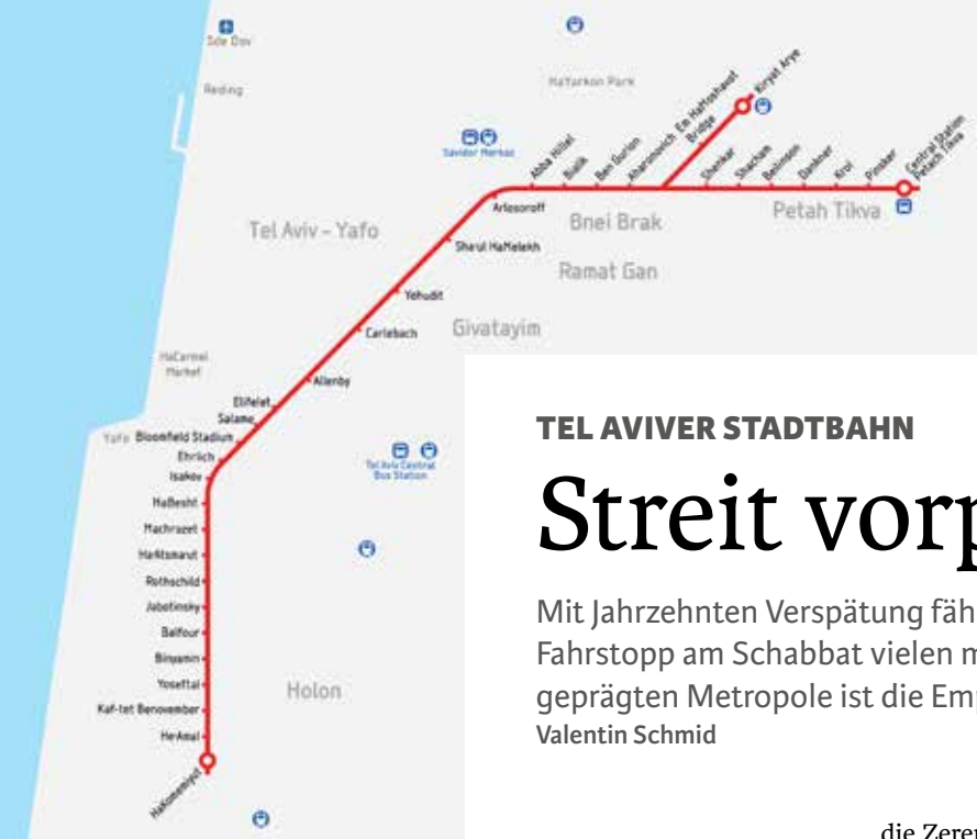
Der Streckenplan der „roten Linie“