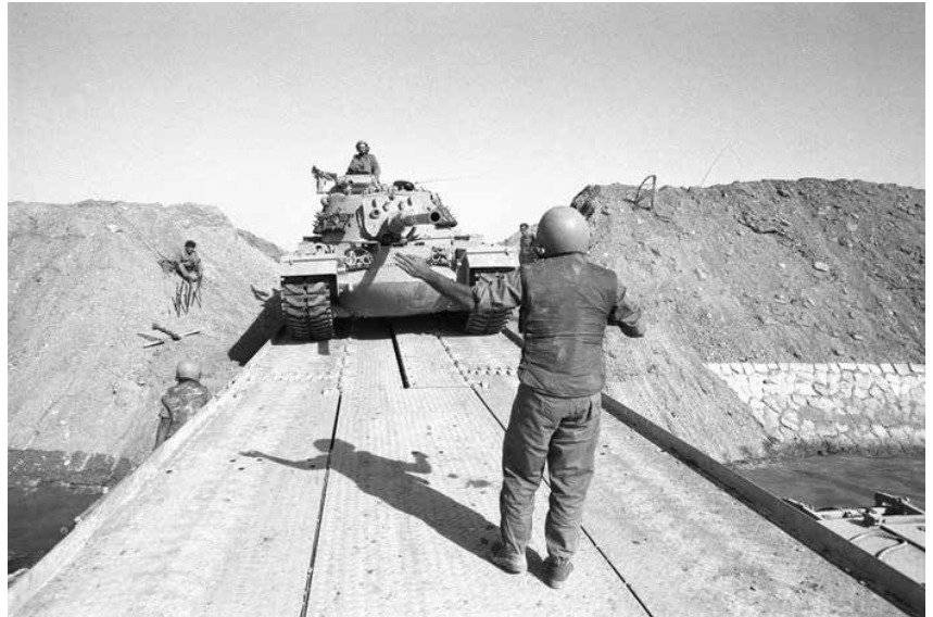
Auf der Sinaihalbinsel waren schwere Panzer während des Jom-Kippur-Krieges stationiert

mal nach Hause. Permanent mussten wir Panzer reparieren. Für die Wartung von 14 Panzern waren jeweils sechs Leute zuständig: Einer war für die Kuppel verantwortlich, einer für die Elektronik, die vier anderen waren Mechaniker. Unsere Panzer waren ständig unter Beschuss.