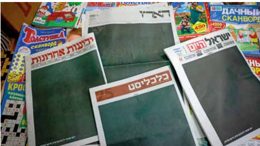
Schwarz wie die Nacht: Einige Zeitungen gaben ihre Titelseiten für eine Anzeigenkampagne von Tech-Unternehmen her

Immerhin: Aus der Regierung kommen Signale, es bei weiteren Reformplänen wie der Richterernennung langsamer angehen zu lassen. Deri hat zudem den interessanten Gedanken formuliert, bei einzelnen Vorhaben eine Kompromissversion zu nehmen, auch wenn kein Kompromiss mit der Opposition erreicht wurde. Falls das gelingt, bleibt zu hoffen, dass auch die Gegner dieses Bemühen anerkennen. |